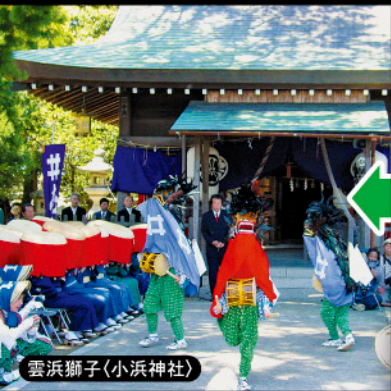
雲浜獅子(小浜神社)