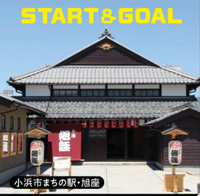
小浜市まちの駅・旭座