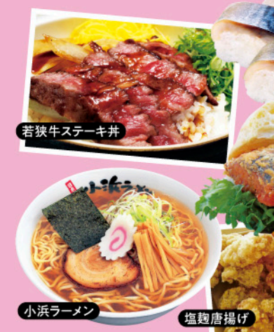
若狭牛ステーキ丼

▼ ゴールしたら必ず 特典 若狭牛ステーキ 屋台村食券プレゼント 写真はイメージです