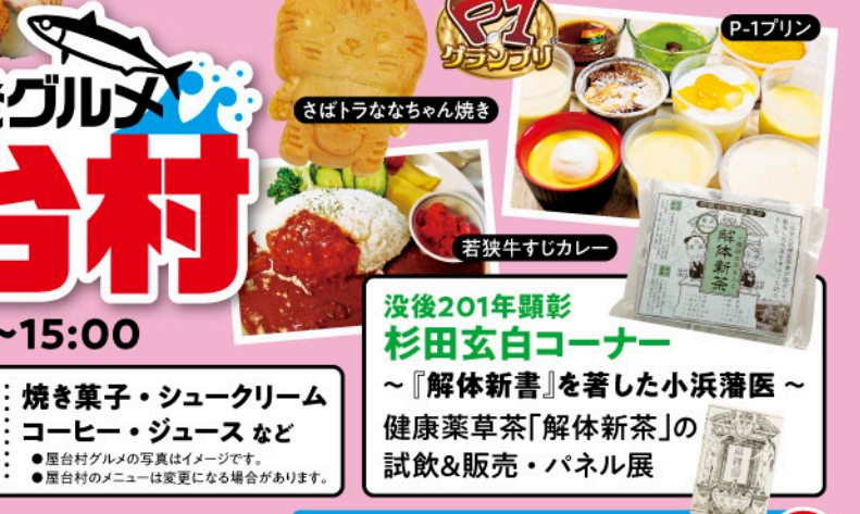
さぼらななちゃん焼き