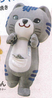
さばトラ ななちゃん 小浜市公認キャラクター