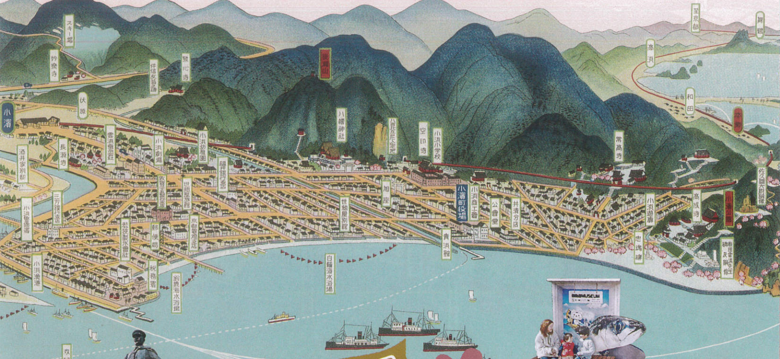
昭和8年頃の小浜 吉田初三郎「わかさ小浜」(部分)