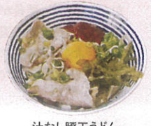
汁なし豚玉うどん