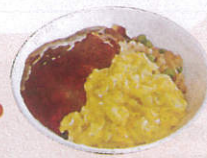
ふわとろオムライス