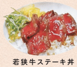
若狹牛ステーキ丼