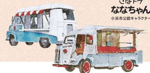
さびトラ ななちゃん 小浜市公認キャラクター