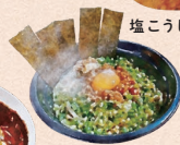
台湾まぜそば 韓国海苔