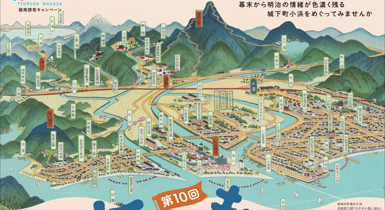
昭和8年頃の小浜 吉田初三郎「わかさ小浜」(部分)